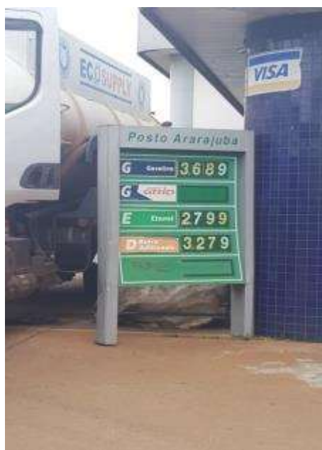
Figura 2: ponto de revenda