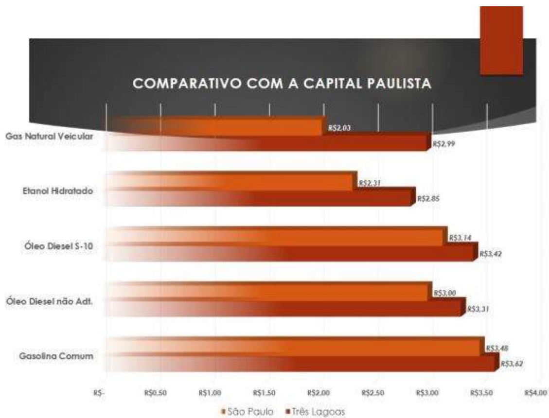
Gráfico 6: Comparativo - Três Lagoas/São Paulo

O NPE/TL é mais uma atividade proativa da Secretaria de Desenvolvimento Econômico que compreende os compassos da expansão econômica três-lagoense, uma das mais dinâmicas no interior do Brasil.