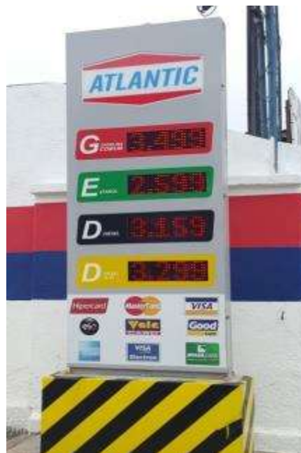
Figura 3: ponto de revenda

O NPE/TL é mais uma atividade proativa da Secretaria de Desenvolvimento Econômico que compreende os compassos da expansão econômica três-lagoense, uma das mais dinâmicas no interior do Brasil.