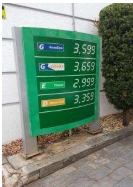
Figura 4: ponto de revenda