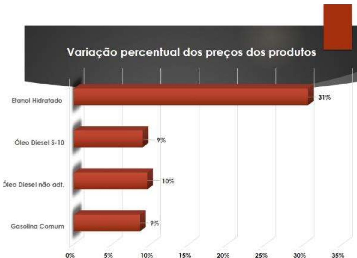
Gráfico 3: Variação percentual por produtos

De acordo com os dados coletados, o combustível que possui a maior variação de preços em Três Lagoas é o Etanol hidratado com cerca de 31% de diferença de um estabelecimento para outro, o Etanol atinge o valor máximo de R$ 3,38 e o mínimo de R$ 2,59. Pode-se atribuir a vários fatores favorecedores dessa variância de valor final do produto na bomba tais como a tributação do combustível (como salientado no início da pesquisa, demanda de mercado local, localização do posto dentre outros fatores.