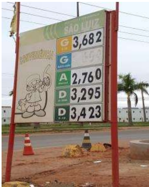
Figura 5: ponto de revenda