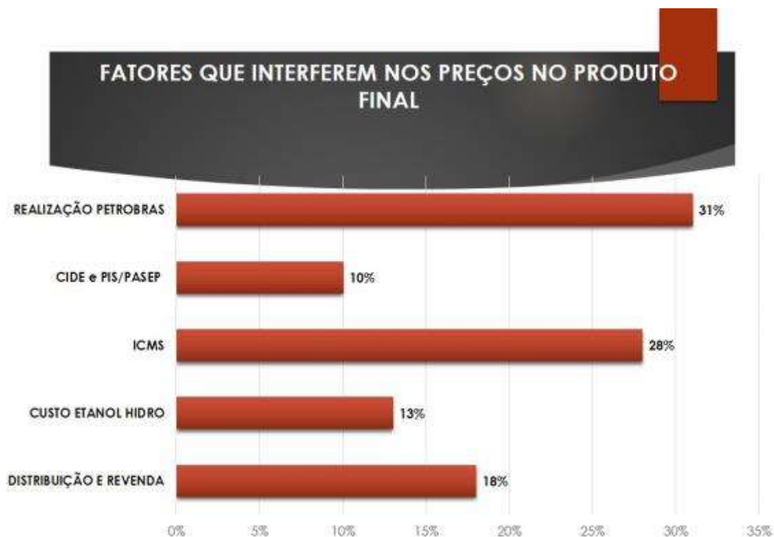
Gráfico 1: Impostos sobre combustíveis no Brasil

O NPE/TL é mais uma atividade proativa da Secretaria de Desenvolvimento Econômico que compreende os compassos da expansão econômica três-lagoense, uma das mais dinâmicas no interior do Brasil.