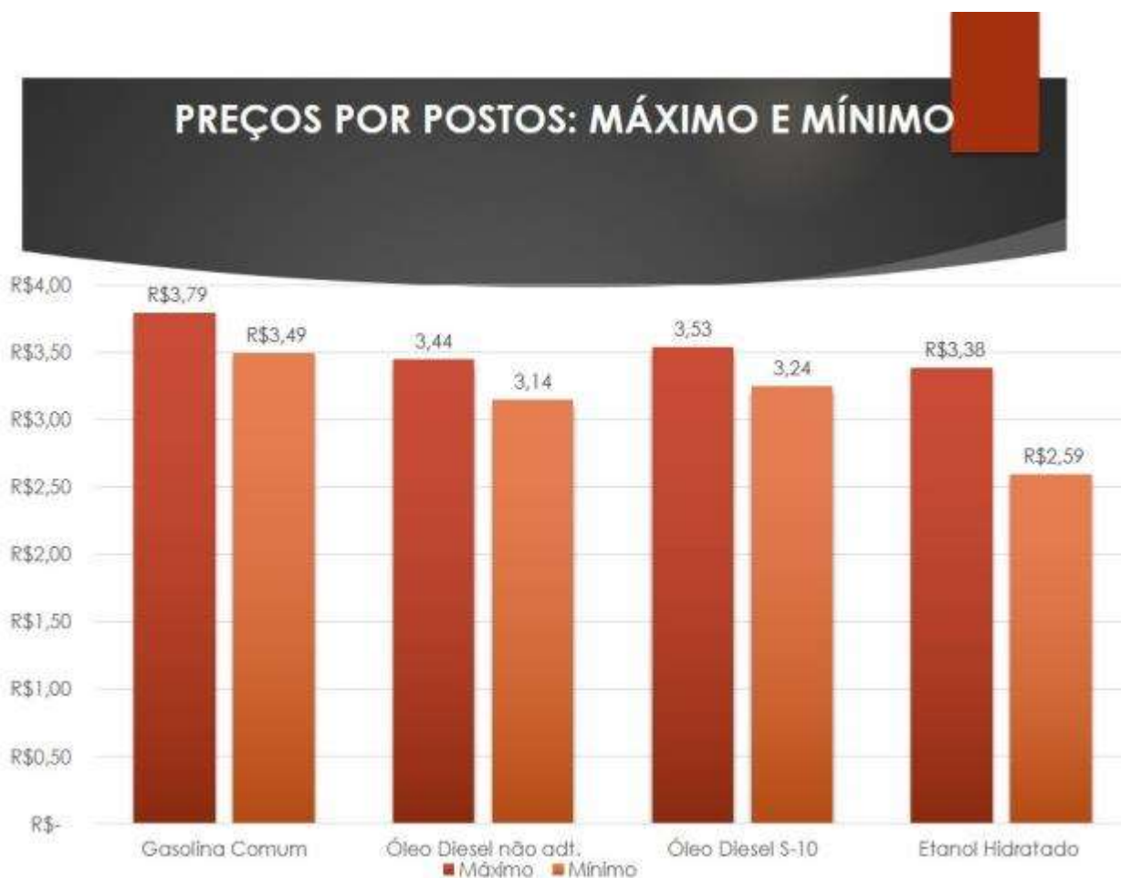
Gráfico 2: Preços por postos

Feita essa ressalva, em Três Lagoas os preços nos dezessete postos, os preços entre o máximo e o mínimo valor variam entre R$ 3,79 a R$3,49 para a gasolina comum, com percentual variável de 9%. Já o óleo diesel não aditivado, utilizado em caminhões e caminhonetes, possui o máximo de R$ 3,44 e o mínimo de R$ 3,14 o que representa variância de 10% nos postos de Três Lagoas. Outro combustível também utilizado para esses veículos de médio e grande porte, o óleo diesel S-10, o mínimo comercializado no município é de R$ 3,24 com máximas de R$ 3,53 esses valores variam na cidade em 9% de um posto para outro (Gráficos 2 e 3).