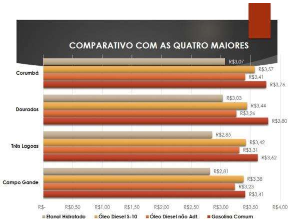
Gráfico 4: Comparativo de preços de combustíveis

A gasolina da capital de Mato Grosso do Sul, Campo Grande, apresenta uma média de R$ 3,41, abaixo da média de Três Lagoas que é de R$ 3,62, ou seja, 6% mais barata do que a gasolina três-lagoense. É válido ressaltar que o combustível comercializado em Três Lagoas está acima da média apenas em relação a Campo Grande, analisando os dados de Corumbá e Dourados, por exemplo, a Gasolina de Três Lagoas é 5% mais barata do que a de Dourados comercializada a R$ 3,80 e 4% em relação a Corumbá que apresenta média de preços do combustível na bomba de R$ 3,76.